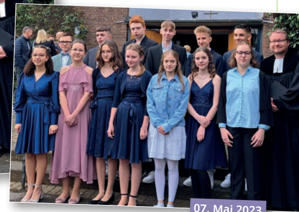
07. Mai 2023