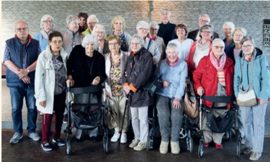
Seniorenfreizeitgruppe 2023

Beiträge zum Thema .....4, 12, 14, 16, 32