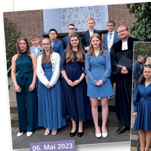
06. Mai 2023