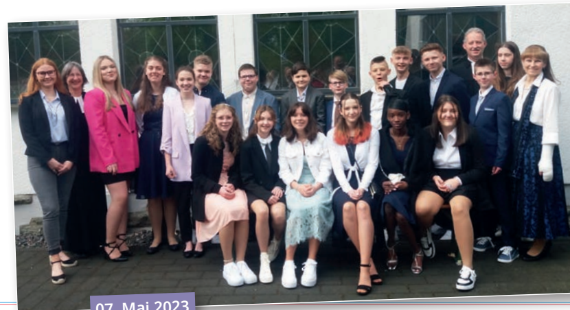
07. Mai 2023

Motto: „Ihr seid das Salz der Erde - ihr seid das Licht der Welt“