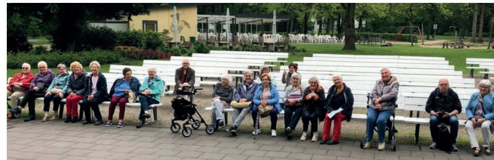
Seniorenfreizeitgruppe im Kurpark in Bad Waldliesborn