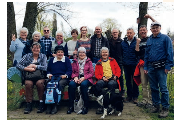
Hier auf unserer letzten Wanderung in Mechelen/NL.

Dankeschööön! Wir freuen uns auf nächste gemeinsame Vorhaben!