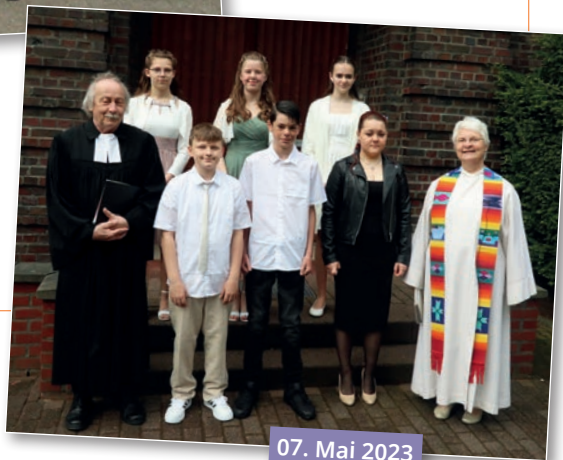
07. Mai 2023