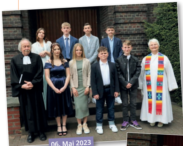
06. Mai 2023