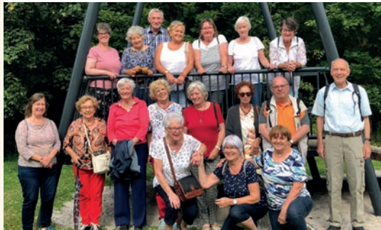
Wandergruppe im Carl_Alexander Park in Baesweiler.