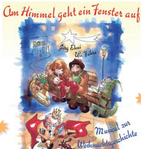
Illustration: Ulrike Graf - Fidula-Verlag