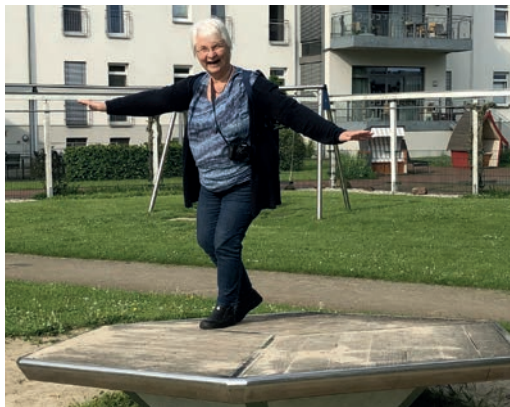
Seniorenfreizeit in Bad Waldliesborn, Foto: Christine Paulus