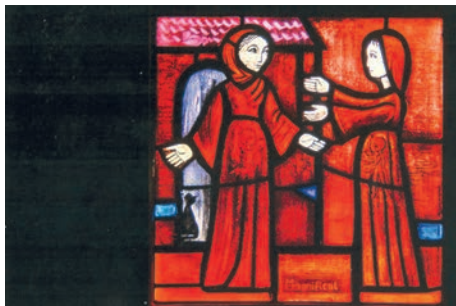
Glasfenster „Magnificat“, frère Éric, Taizé